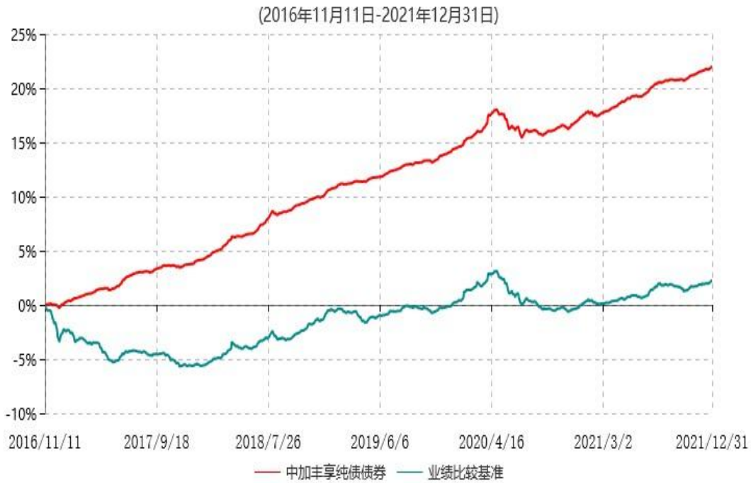
中加丰享纯债债券型证券投资基金累计净值增长率与业绩比较基准收益率历史走势对比图