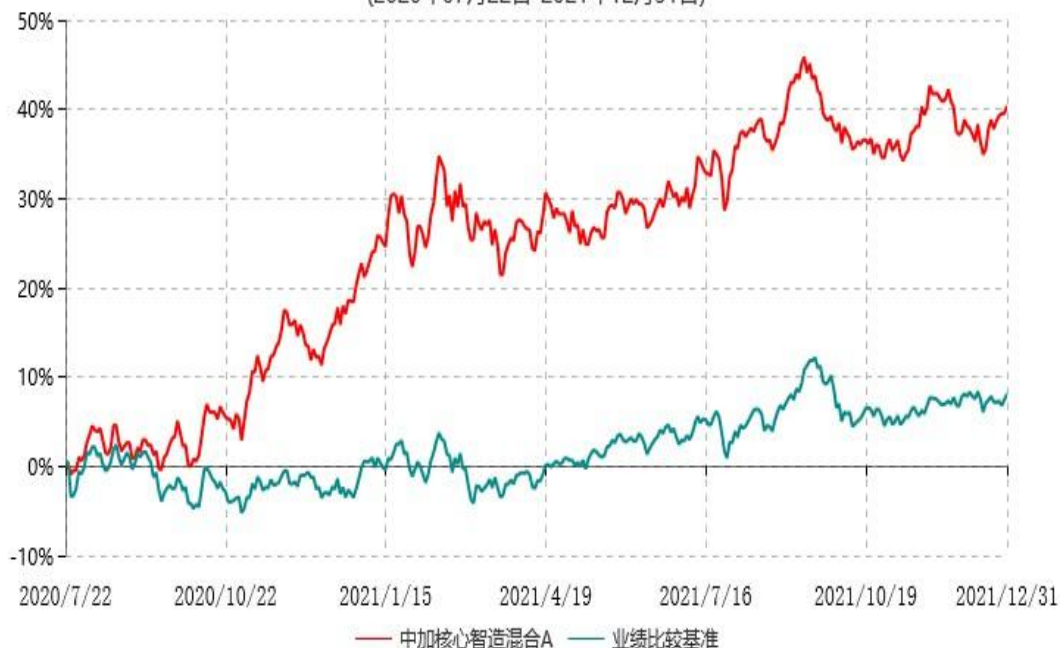
中加核心智造混合A累计净值增长率与业绩比较基准收益率历史走势对比图 (2020年07月22日-2021年12月31日)