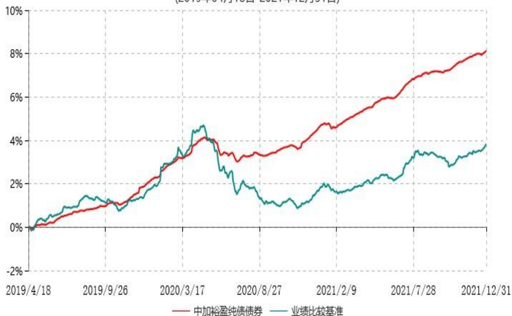
中加裕盈纯债债券型证券投资基金累计净值增长率与业绩比较基准收益率历史走势对比图 (2019年04月18日-2021年12月31日)