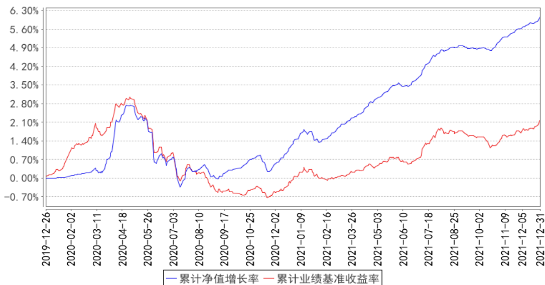
交银裕坤纯债一年定期开放债券累计净值增长率与同期业绩比较基准收益率的历史走势对比图

注：本基金建仓期为自基金合同生效日起的 6 个月。截至建仓期结束，本基金各项资产配置比例符合基金合同及招募说明书有关投资比例的约定。