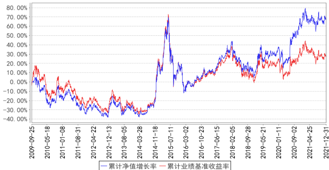
交银上证180公司治理ETF累计净值增长率与同期业绩比较基准收益率的历史走势对比图

注：本基金建仓期为自基金合同生效日起的 3 个月。截至建仓期结束，本基金各项资产配置比例符合基金合同及招募说明书有关投资比例的约定。