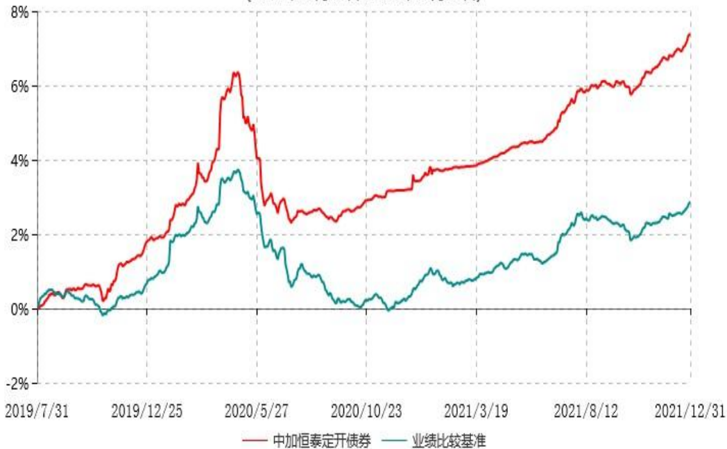
中加恒泰三个月定期开放债券型证券投资基金累计净值增长率与业绩比较基准收益率历史走势对比图 (2019年07月31日-2021年12月31日)