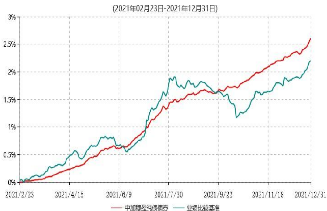
中加穗盈纯债债券型证券投资基金累计净值增长率与业绩比较基准收益率历史走势对比图

注：1. 本基金的基金合同于2021年2月23日生效，截至本报告期末，本基金合同生效未满一年。