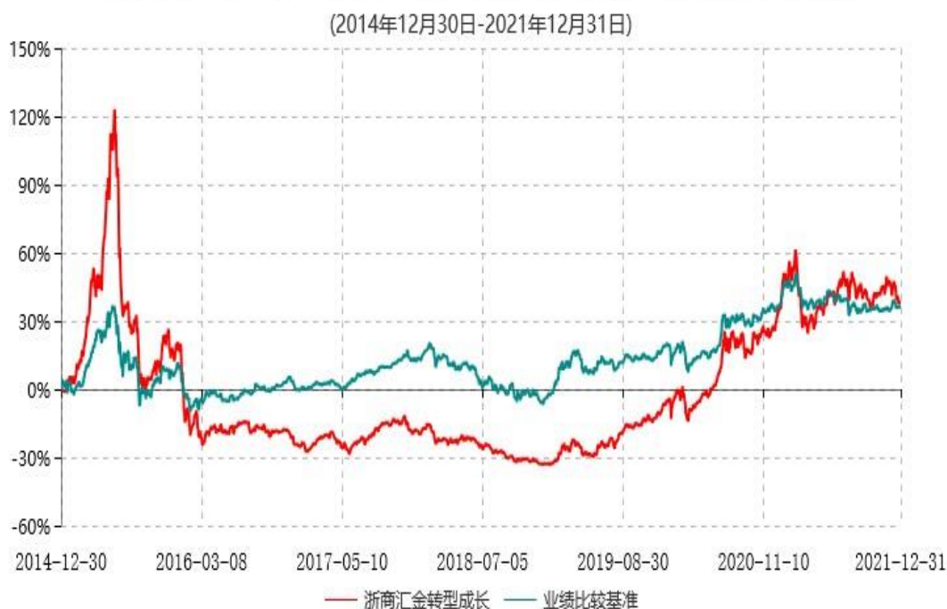
浙商汇金转型成长混合型证券投资基金累计净值增长率与业绩比较基准收益率历史走势对比图