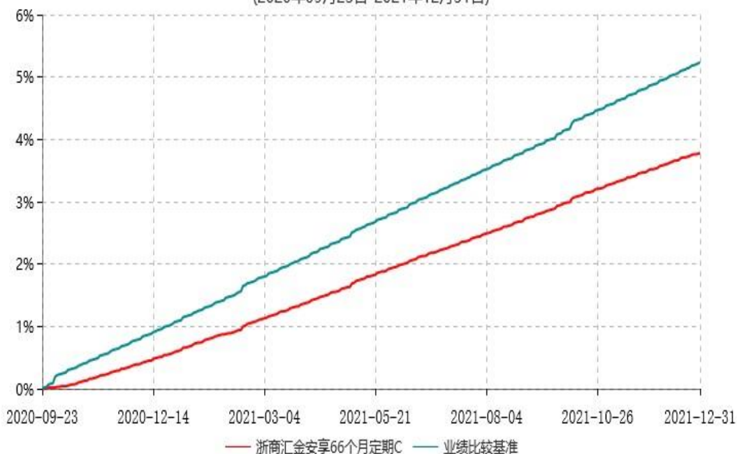
浙商汇金安享66个月定期C累计净值增长率与业绩比较基准收益率历史走势对比图 (2020年09月23日-2021年12月31日)

注：本基金合同生效日为 2020 年 9 月 23 日，至本报告期末，本基金已完成建仓，建仓期为 2020 年 9 月 23 日-2021 年 3 月 22 日，但报告期末距建仓结束不满一年，建仓期结束时各项资产配置比例符合合同约定。