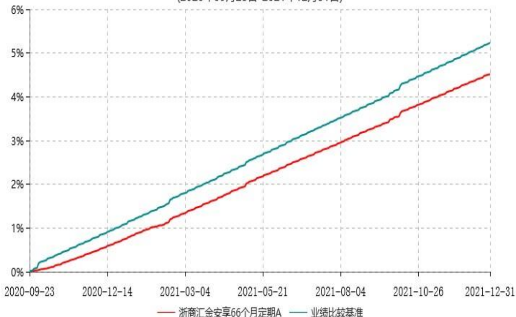
浙商汇金安享66个月定期A累计净值增长率与业绩比较基准收益率历史走势对比图 (2020年09月23日-2021年12月31日)

注：本基金合同生效日为 2020 年 9 月 23 日，至本报告期末，本基金已完成建仓，建仓期为 2020 年 9 月 23 日-2021 年 3 月 22 日，但报告期末距建仓结束不满一年，建仓期结束时各项资产配置比例符合合同约定。