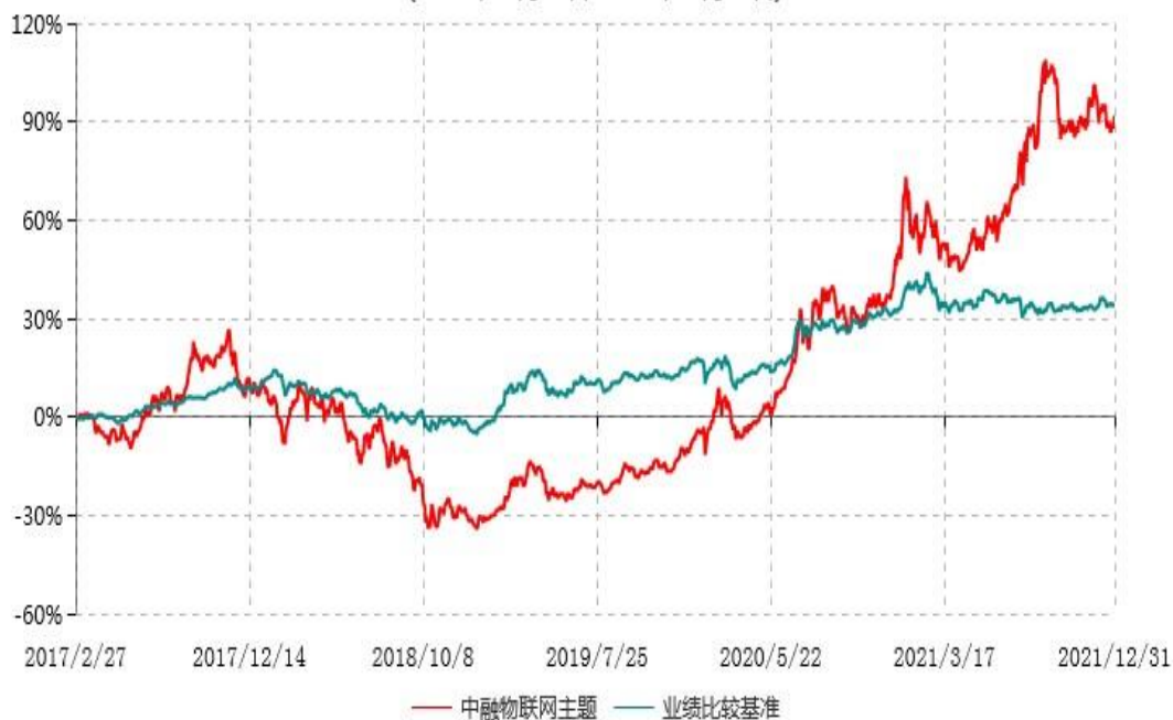
中融物联网主题灵活配置混合型证券投资基金累计净值增长率与业绩比较基准收益率历史走势对比图 (2017年02月27日-2021年12月31日)

注：按基金合同和招募说明书的约定，本基金自基金合同生效日起6个月内为建仓期，建仓期结束时本基金的各项投资比例符合基金合同的有关约定。