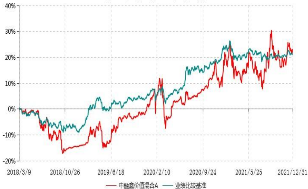
中融鑫价值混合A累计净值增长率与业绩比较基准收益率历史走势对比图 (2018年03月09日-2021年12月31日)