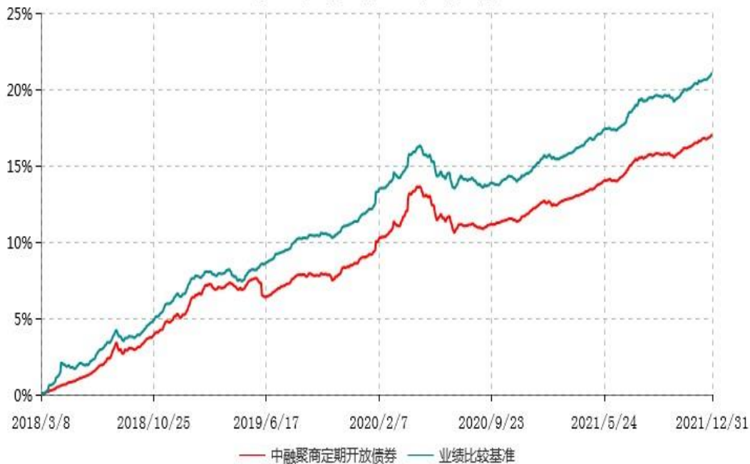
中融聚商3个月定期开放债券型发起式证券投资基金累计净值增长率与业绩比较基准收益率历史走势对比图 (2018年03月08日-2021年12月31日)

注：按基金合同和招募说明书的约定，本基金自基金合同生效日起6个月内为建仓期，建仓期结束时本基金的各项投资比例符合基金合同的有关约定。