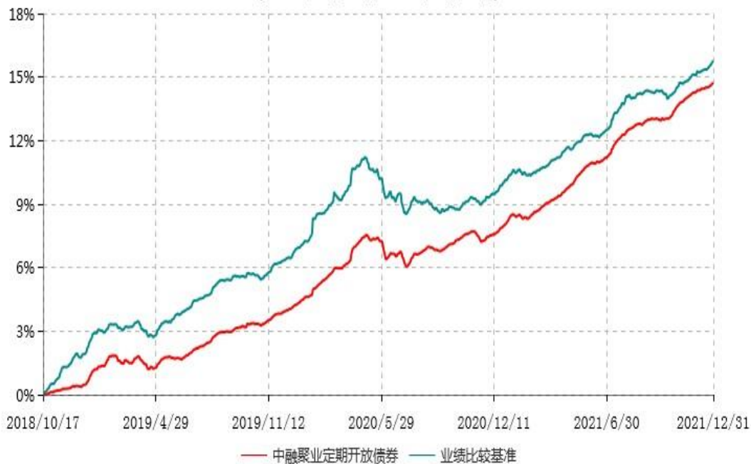
中融聚业3个月定期开放债券型发起式证券投资基金累计净值增长率与业绩比较基准收益率历史走势对比图 (2018年10月17日-2021年12月31日)

注：按基金合同和招募说明书的约定，本基金自基金合同生效日起6个月内为建仓期，建仓期结束时本基金的各项投资比例符合基金合同的有关约定。