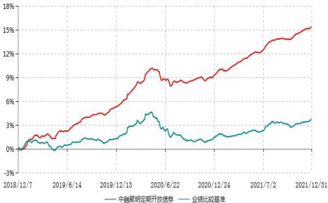
中融聚明3个月定期开放债券型发起式证券投资基金累计净值增长率与业绩比较基准收益率历史走势对比图 (2018年12月07日-2021年12月31日)

注：按基金合同和招募说明书的约定，本基金自基金合同生效日起6个月内为建仓期，建仓期结束时本基金的各项投资比例符合基金合同的有关约定。