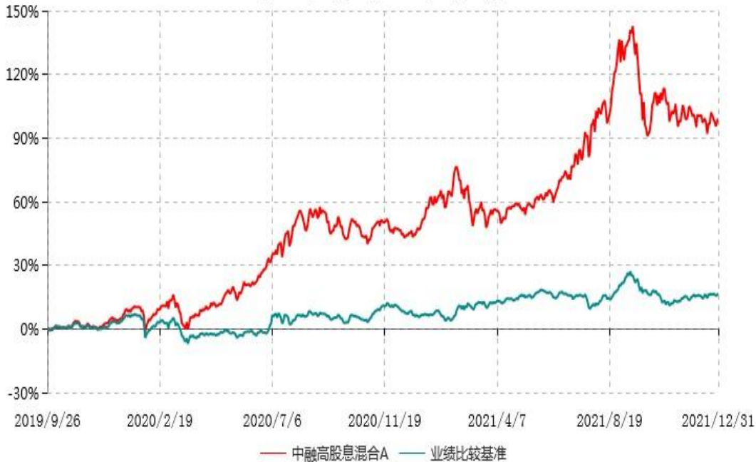
中融高股息混合A累计净值增长率与业绩比较基准收益率历史走势对比图 (2019年09月26日-2021年12月31日)