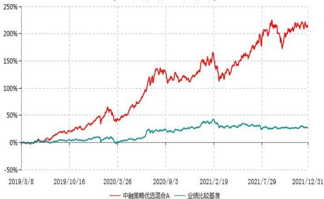
中融策略优选混合A累计净值增长率与业绩比较基准收益率历史走势对比图 (2019年05月08日-2021年12月31日)