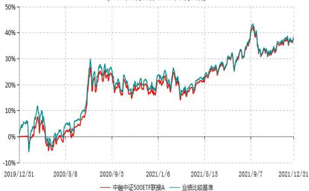
中融中证500ETF联接A累计净值增长率与业绩比较基准收益率历史走势对比图 (2019年12月31日-2021年12月31日)