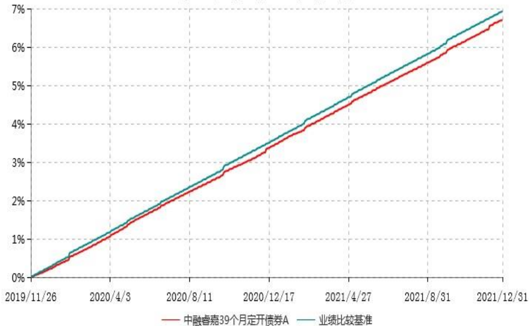
中融睿嘉39个月定开债券A累计净值增长率与业绩比较基准收益率历史走势对比图 (2019年11月26日-2021年12月31日)