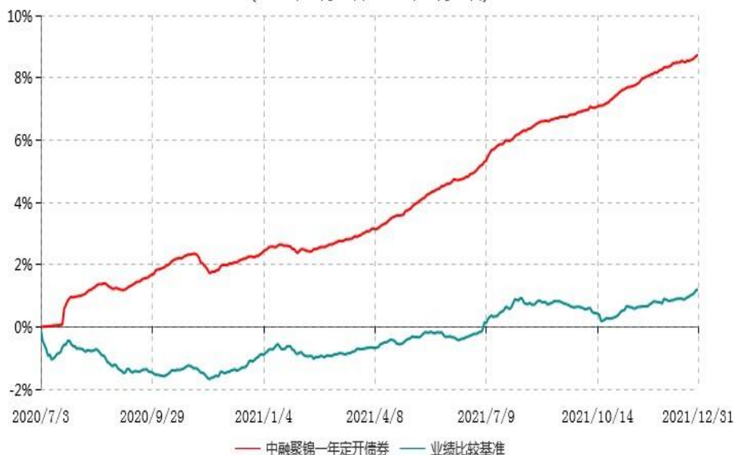
中融聚锦一年定期开放债券型发起式证券投资基金累计净值增长率与业绩比较基准收益率历史走势对比图 (2020年07月03日-2021年12月31日)

注：按基金合同和招募说明书的约定，本基金自基金合同生效日起6个月内为建仓期，建仓期结束时本基金的各项投资比例符合基金合同的有关约定。