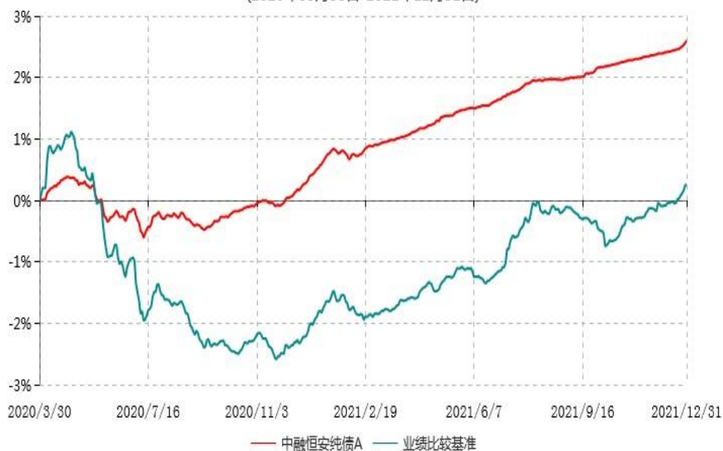
中融恒安纯债A累计净值增长率与业绩比较基准收益率历史走势对比图 (2020年03月30日-2021年12月31日)