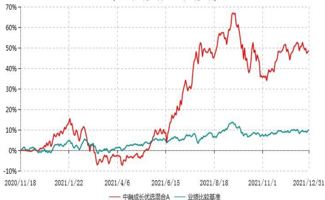
中融成长优选混合A累计净值增长率与业绩比较基准收益率历史走势对比图 (2020年11月18日-2021年12月31日)