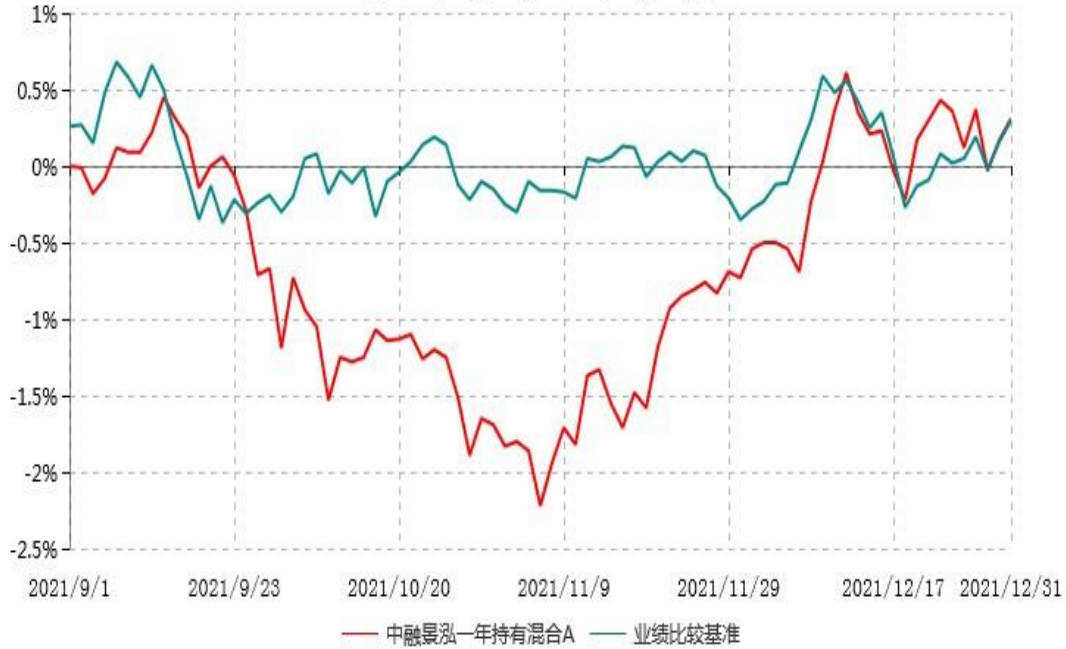
中融景泓一年持有混合A累计净值增长率与业绩比较基准收益率历史走势对比图 (2021年09月01日-2021年12月31日)