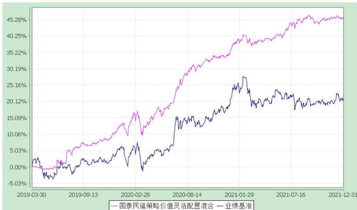
自基金转型以来份额累计净值增长率与业绩比较基准收益率的历史走势对比图 (2019 年 3 月 30 日至 2021 年 12 月 31 日)