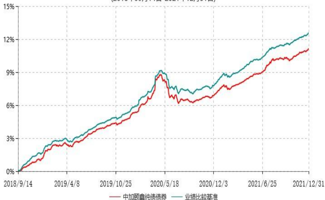
中加颐鑫纯债债券型证券投资基金累计净值增长率与业绩比较基准收益率历史走势对比图 (2018年09月14日-2021年12月31日)