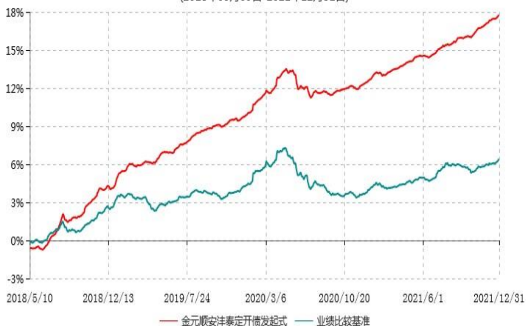
金元顺安洋泰定期开放债券型发起式证券投资基金累计净值增长率与业绩比较基准收益率历史走势对比图 (2018年05月09日-2021年12月31日)