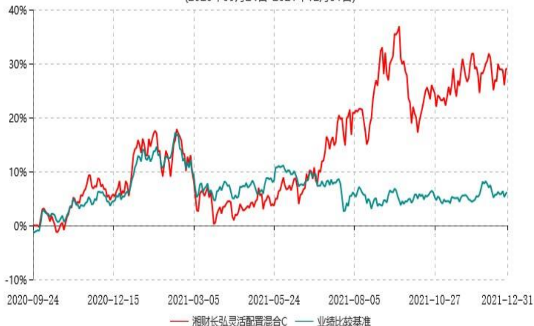
湘财长弘灵活配置混合C累计净值增长率与业绩比较基准收益率历史走势对比图 (2020年09月24日-2021年12月31日)