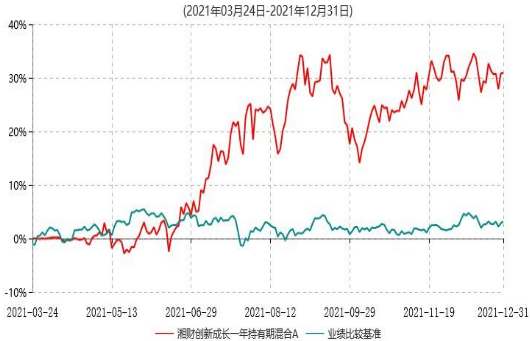
湘财创新成长一年持有期混合A累计净值增长率与业绩比较基准收益率历史走势对比图