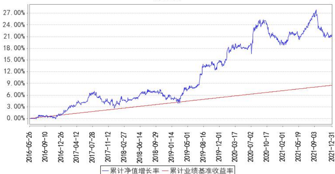
华泰柏瑞量化对冲混合累计净值增长率与同期业绩比较基准收益率的历史走势对比图

注：图示日期为 2016 年 5 月 26 日至 2021 年 12 月 31 日。