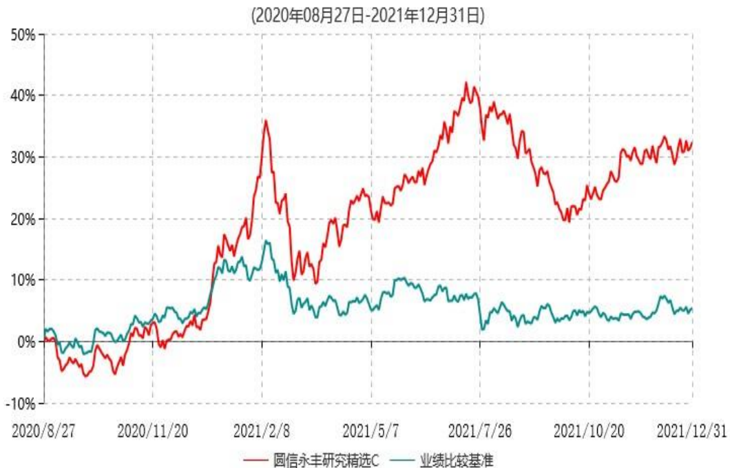
圆信永丰研究精选C累计净值增长率与业绩比较基准收益率历史走势对比图

注：自基金合同生效后，截止报告期末，本基金成立满一年；本基金已完成建仓但报告期末距建仓结束不满一年，建仓结束时各项资产配置比例符合合同约定。