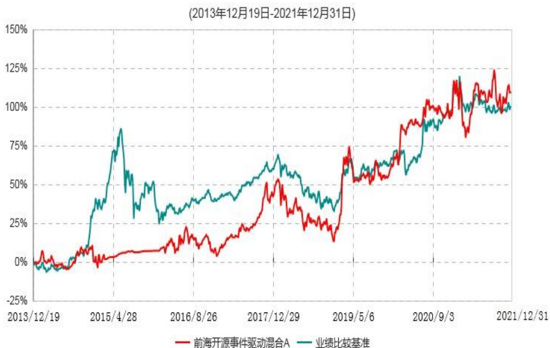
前海开源事件驱动混合A累计净值增长率与业绩比较基准收益率历史走势对比图