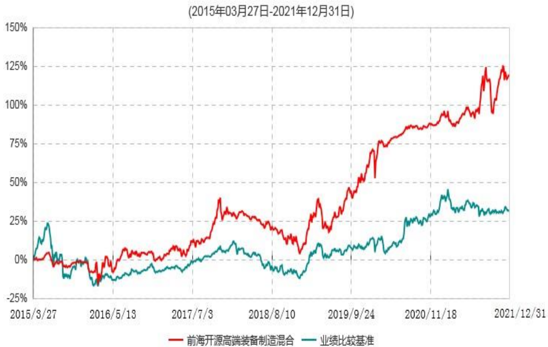
前海开源高端装备制造灵活配置混合型证券投资基金累计净值增长率与业绩比较基准收益率历史走势对比图