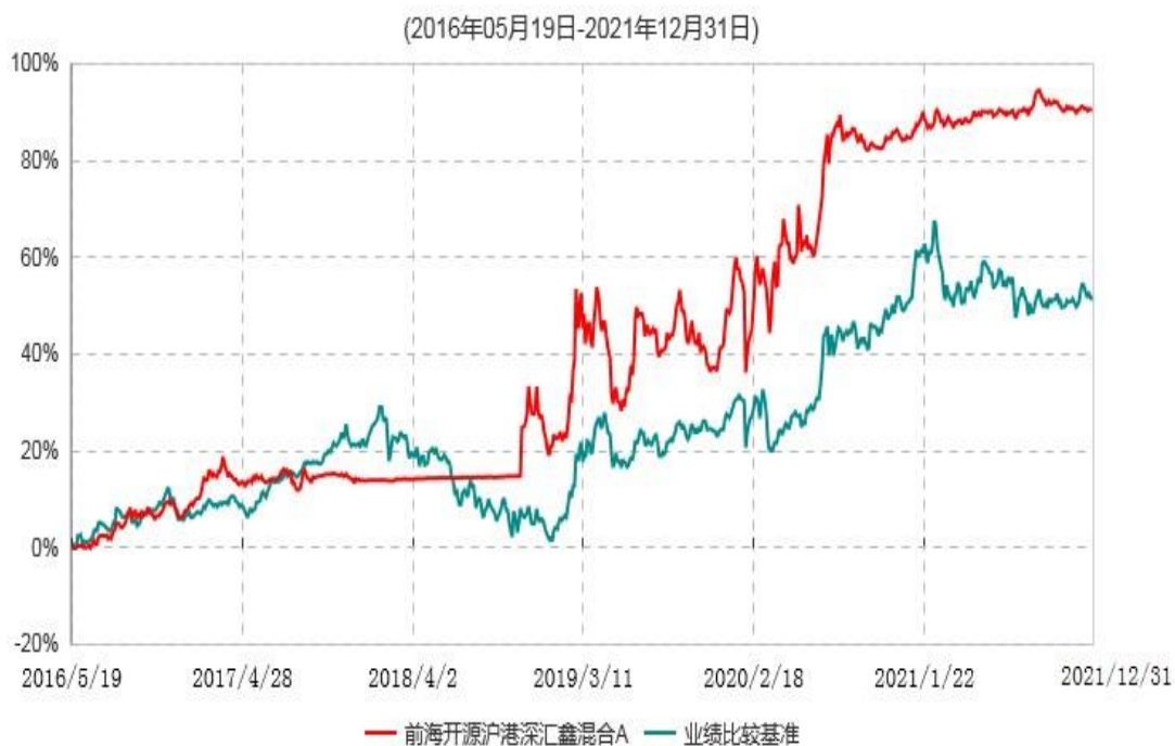
前海开源沪港深汇鑫混合A累计净值增长率与业绩比较基准收益率历史走势对比图