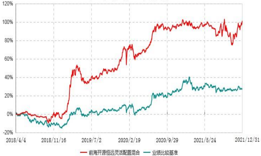
前海开源恒远灵活配置混合型证券投资基金累计净值增长率与业绩比较基准收益率历史走势对比图 (2018年04月04日-2021年12月31日)

注：2018年4月4日（含当日）起，本基金转型为“前海开源恒远灵活配置混合型证券投资基金”。