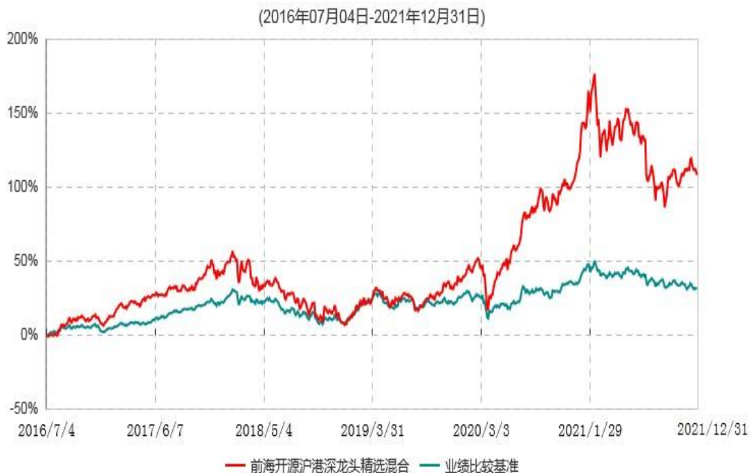
前海开源沪港深龙头精选灵活配置混合型证券投资基金累计净值增长率与业绩比较基准收益率历史走势对比图