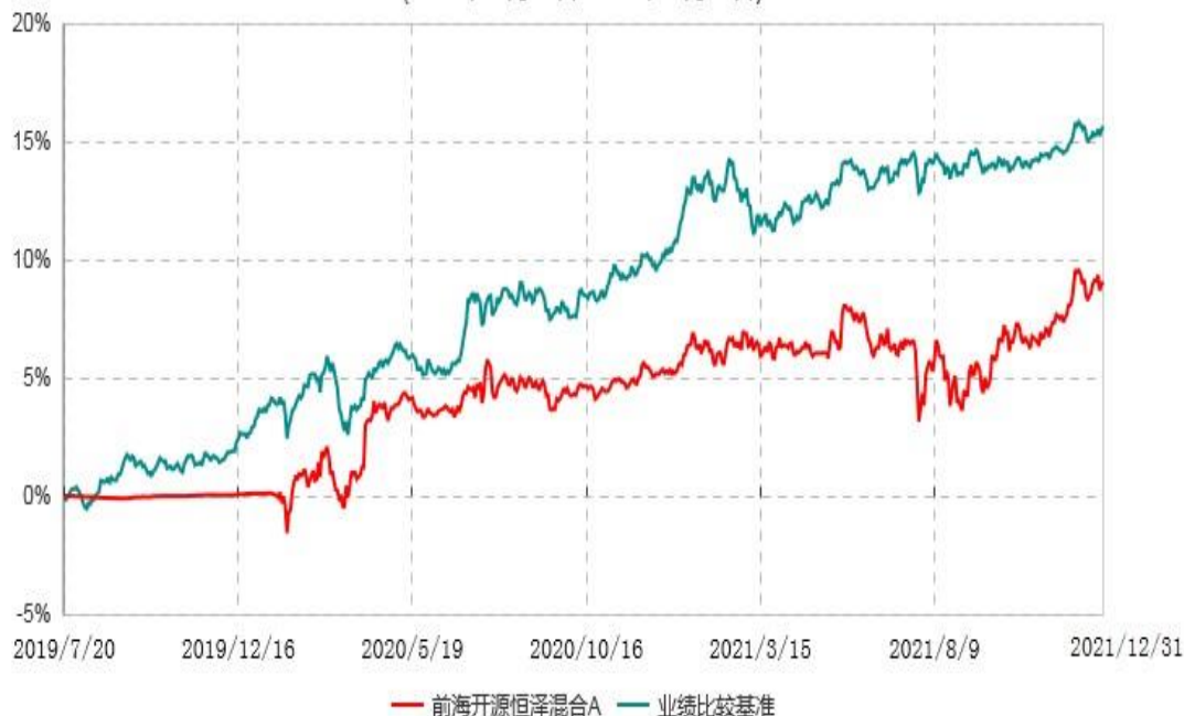
前海开源恒泽混合C累计净值增长率与业绩比较基准收益率历史走势对比图