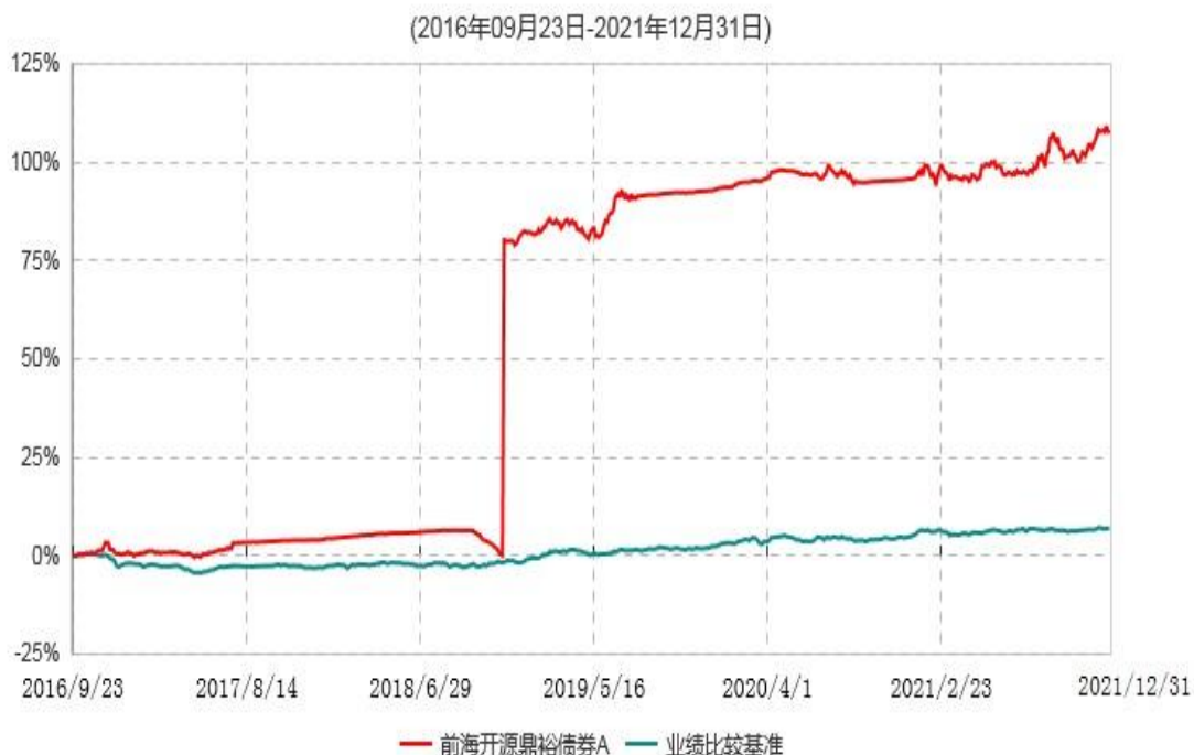
前海开源鼎裕债券A累计净值增长率与业绩比较基准收益率历史走势对比图