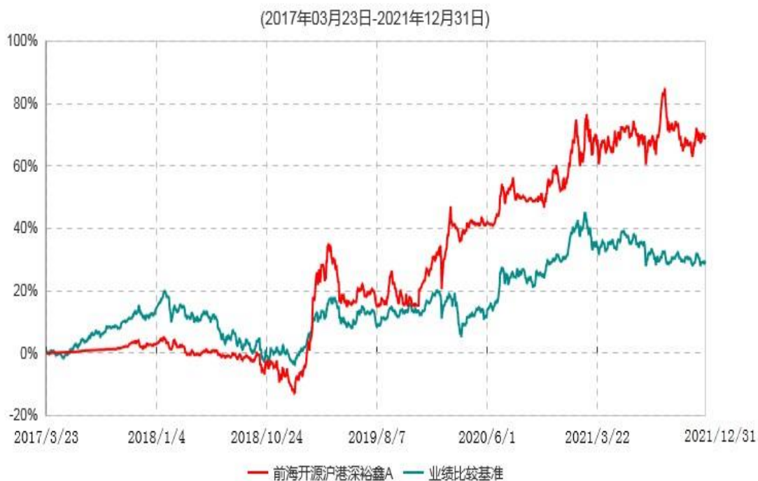
前海开源沪港深裕鑫A累计净值增长率与业绩比较基准收益率历史走势对比图