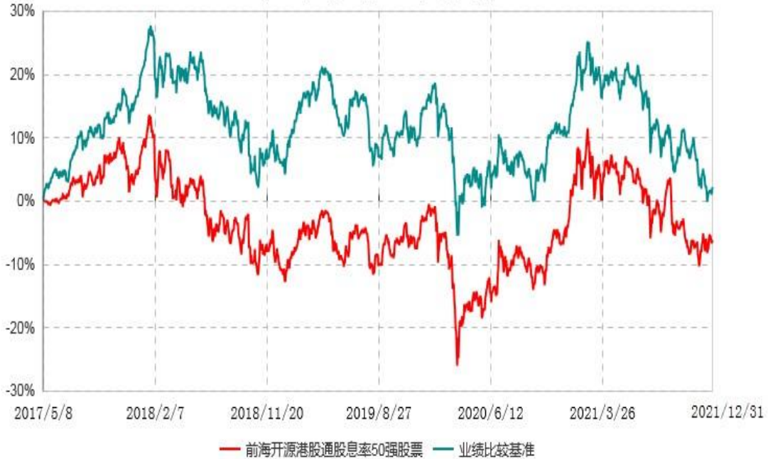
前海开源港股通股息率50强股票型证券投资基金累计净值增长率与业绩比较基准收益率历史走势对比图 (2017年05月08日-2021年12月31日)