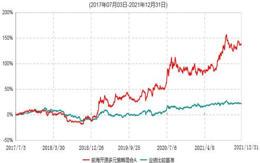
前海开源多元策略混合A累计净值增长率与业绩比较基准收益率历史走势对比图