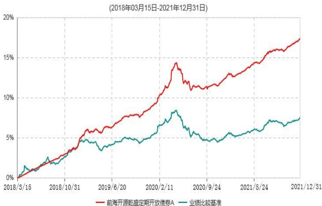
前海开源乾盛定期开放债券A累计净值增长率与业绩比较基准收益率历史走势对比图