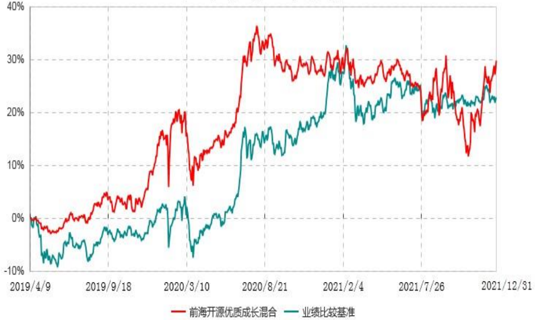
前海开源优质成长混合型证券投资基金累计净值增长率与业绩比较基准收益率历史走势对比图 (2019年04月09日-2021年12月31日)