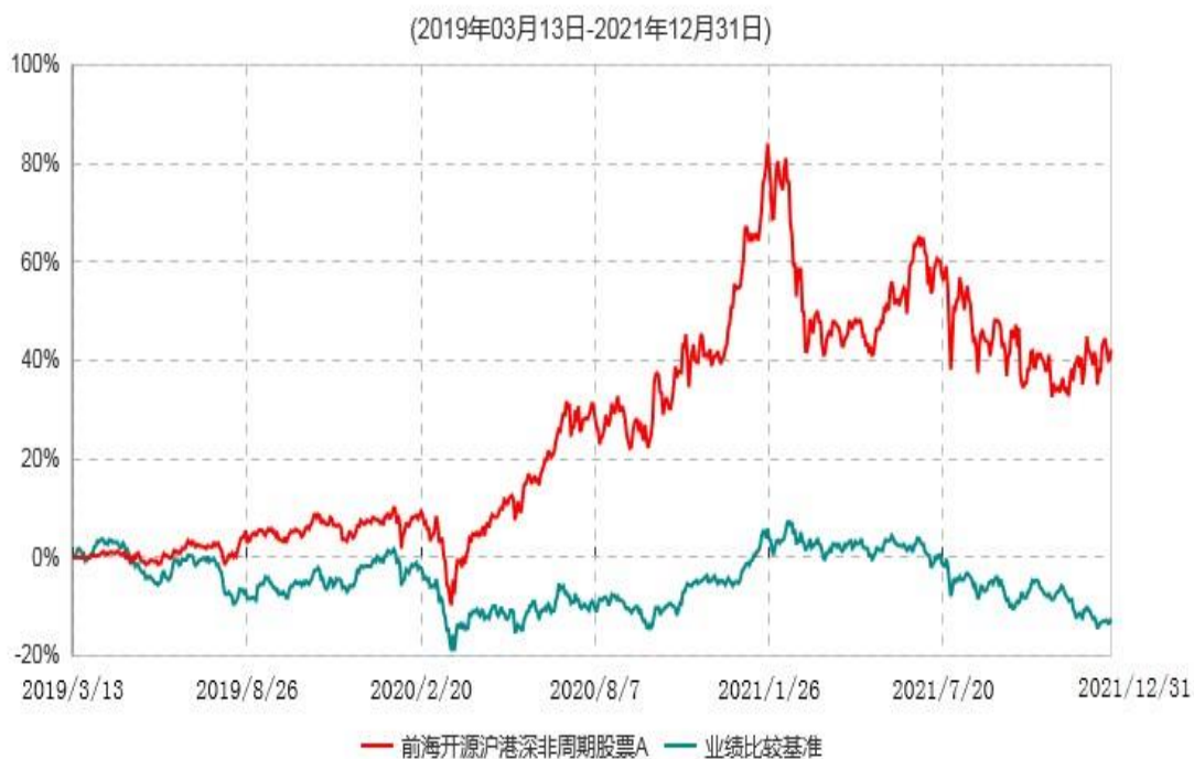
前海开源沪港深非周期股票A累计净值增长率与业绩比较基准收益率历史走势对比图