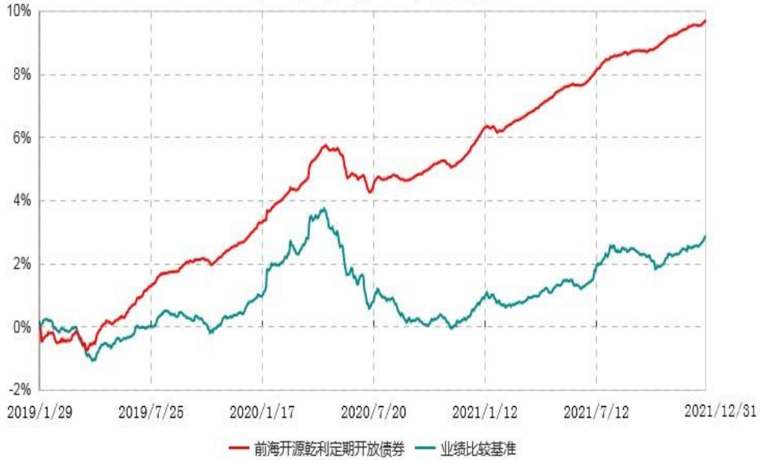
前海开源乾利3个月定期开放债券型发起式证券投资基金累计净值增长率与业绩比较基准收益率历史走势对比图 (2019年01月29日-2021年12月31日)