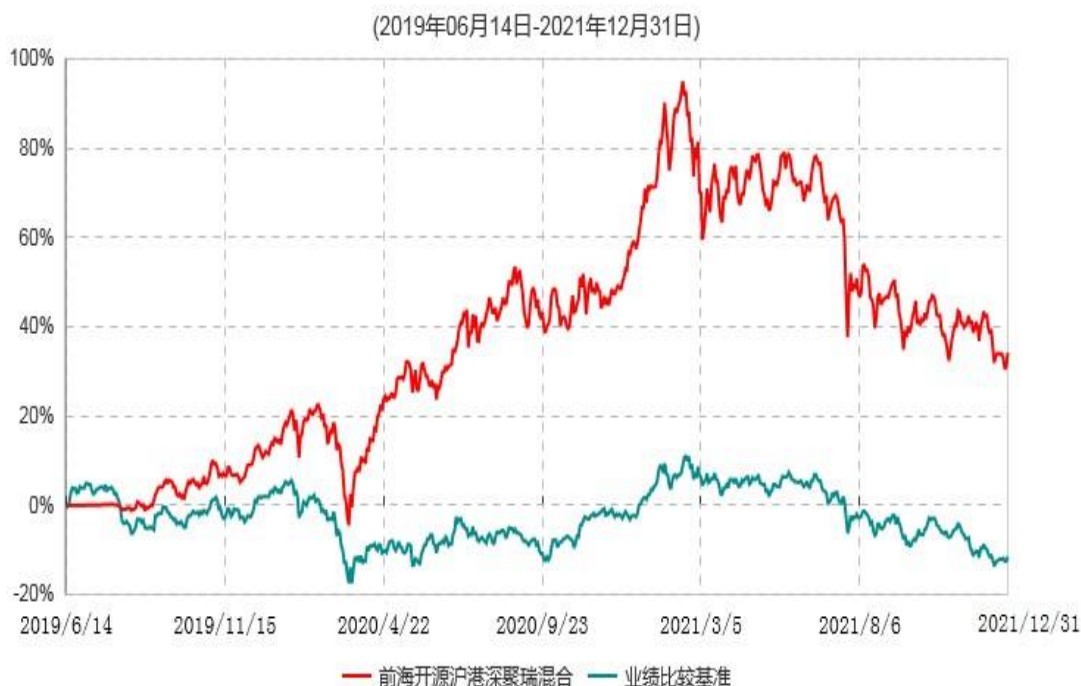
前海开源沪港深聚瑞混合型证券投资基金累计净值增长率与业绩比较基准收益率历史走势对比图