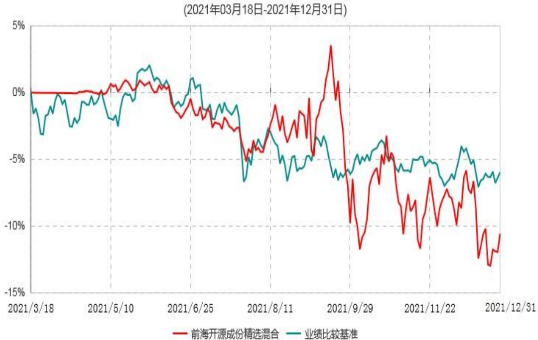
前海开源成份精选混合型证券投资基金累计净值增长率与业绩比较基准收益率历史走势对比图

注：①本基金的基金合同于2021年3月18日生效，截至2021年12月31日，本基金成立未 满1年。