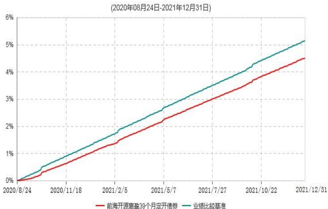
前海开源惠盈39个月定期开放债券型证券投资基金累计净值增长率与业绩比较基准收益率历史走势对比图

注：本基金的建仓期为6个月，建仓期结束时各项资产配置比例符合基金合同规定。截至2021年12月31日，本基金建仓期结束未满1年。