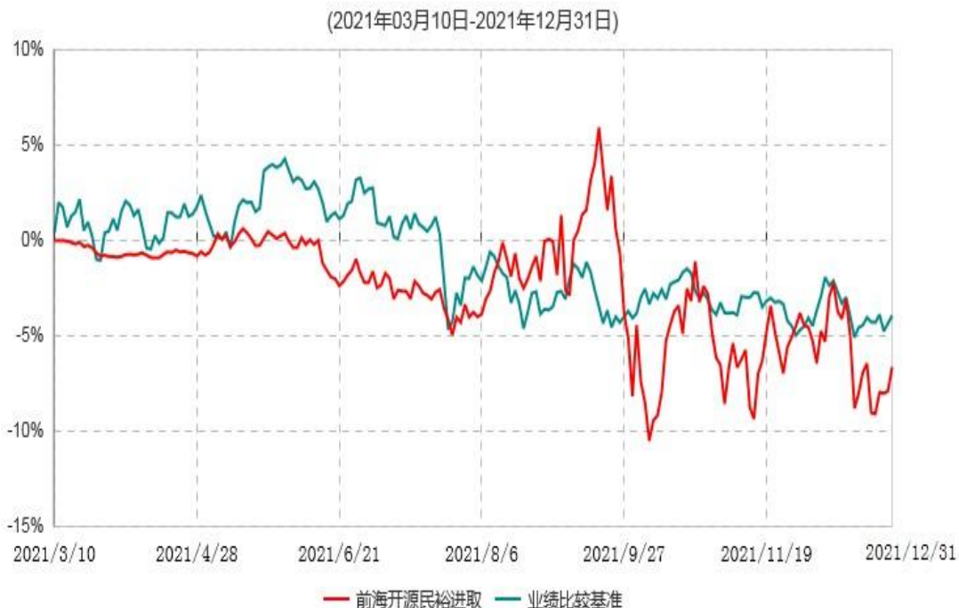
前海开源民裕进取混合型证券投资基金累计净值增长率与业绩比较基准收益率历史走势对比图

注：①本基金的基金合同于2021年3月10日生效，截至2021年12月31日止，本基金成立未满1年。