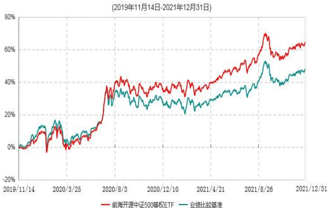
前海开源中证500等权重交易型开放式指数证券投资基金累计净值增长率与业绩比较基准收益率历史走势对比图