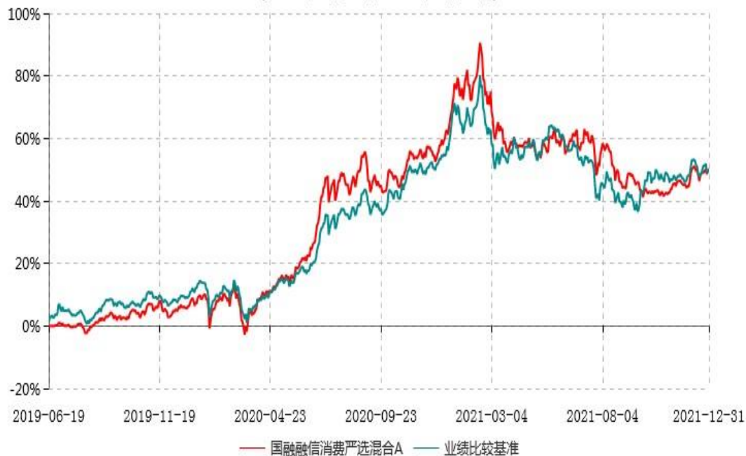
国融融信消费严选混合A累计净值增长率与业绩比较基准收益率历史走势对比图 (2019年06月19日-2021年12月31日)