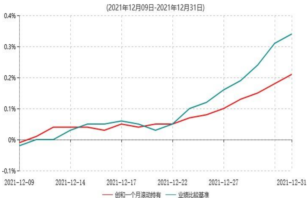
第一创业创和一个月滚动持有债券型集合资产管理计划累计净值增长率与业绩比较基准收益率历史走势对比图